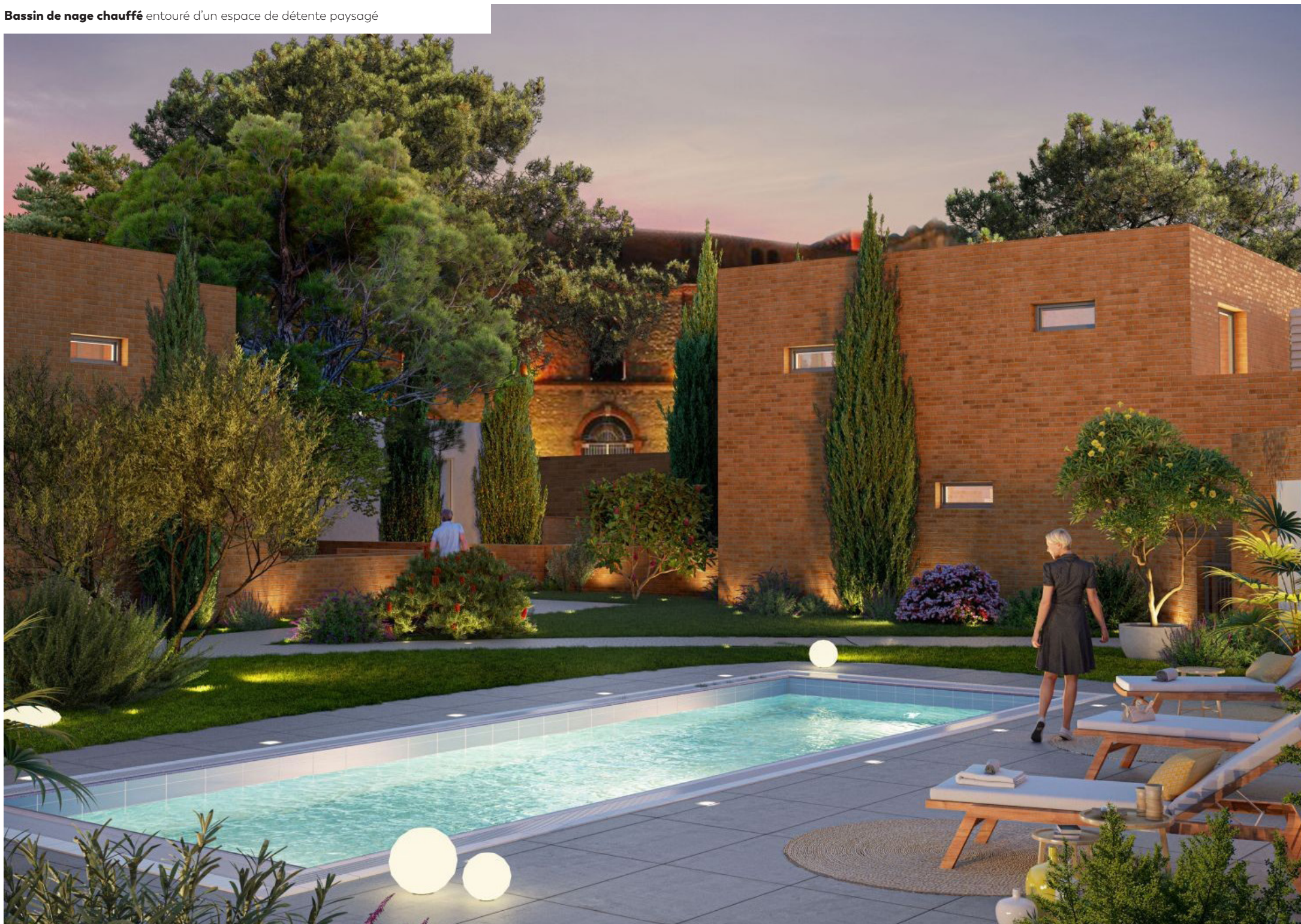
Bassin de nage chauffé entouré d'un espace de détente paysagé