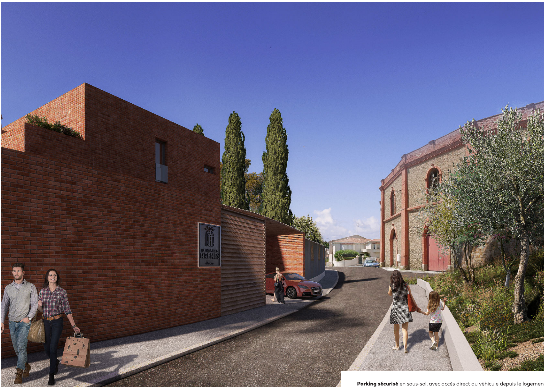
Parking sécurisé en sous-sol, avec accès direct au véhicule depuis le logement