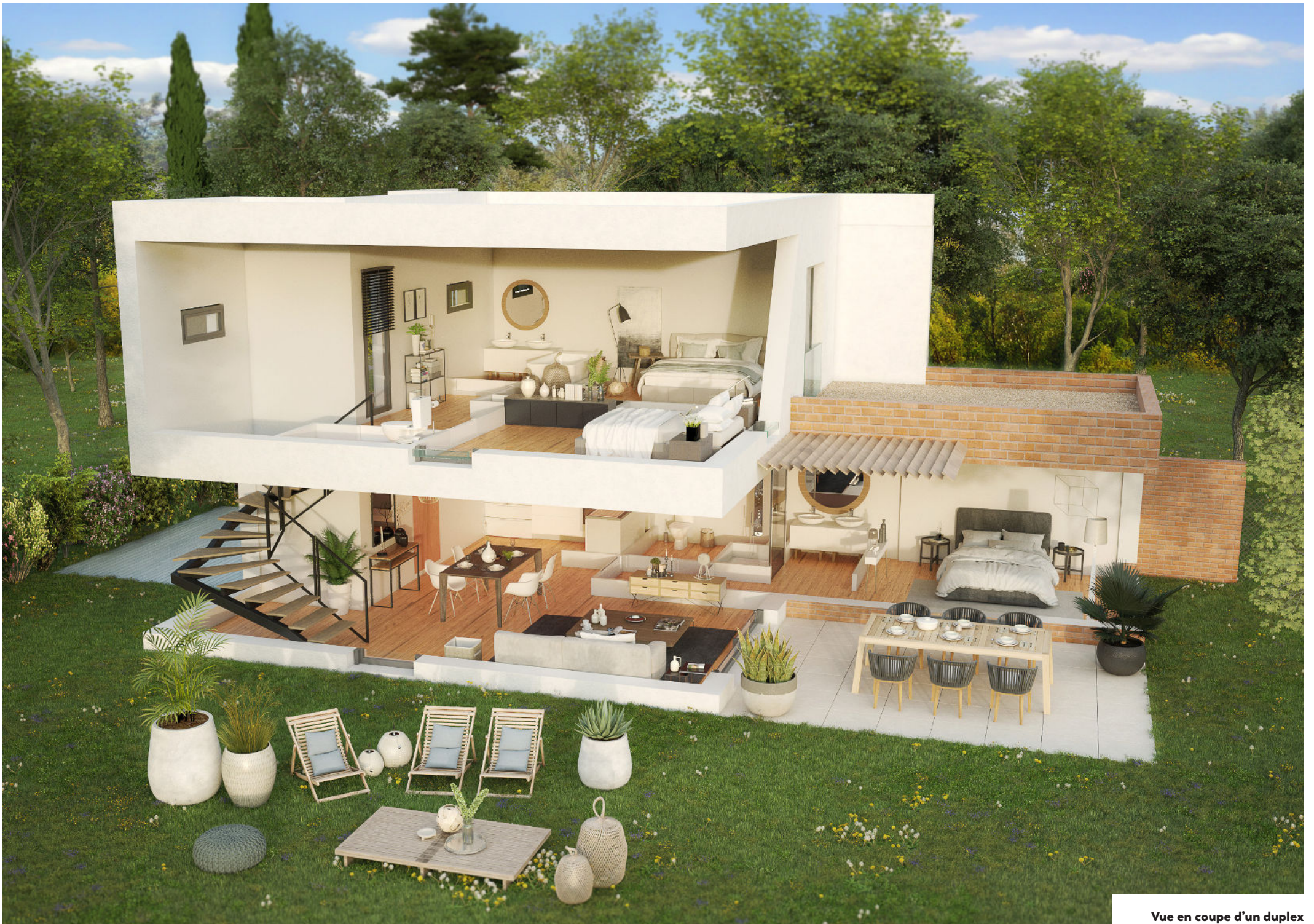
Vue en coupe d'un duplex